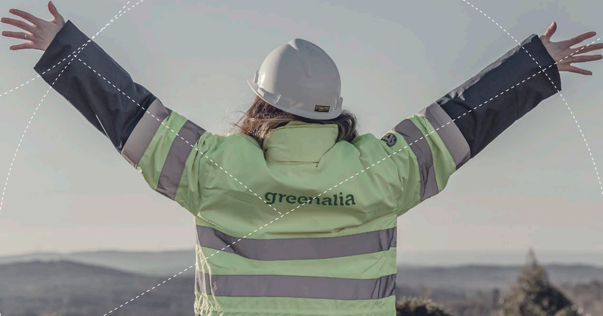
Entorno del Parque Eólico de Monte Tourado (10,4MW)